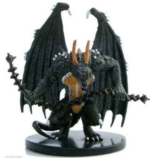
Figure 1 goblin misy tandroka

"Ry devoly! Ry fanahy ratsy! Asio amin'ny hery manontolo! 'ndao daholo ho any amin'ny 'Lord's church' hanafika an'I Baek Bong Nyu!" Maro ny fanahy ratsy niditra tao am-batako, nivondrombondrona hametraka fivontosana. Avy teo dia izy ireo dia niparitrika nanerana ny vatako. Ny sasany mitovy amin'ny goblins misy tandroka, Ny iray hafa mitovy amim-bibilava maro loko, Ny sasany indray nivotirika sady nanana hoho sy nify maranitra, nitafy fotsy. Nanaintaina tsy hay zakaina avokoa ny vatako manontolo, naolany ny vanintaolako. Azoko tsara izao ny nahazo an-drapasy ilay izy notafihina iny. Niezaka hatramin'ny farany aho hivavaka sy hanohitra ireo fanafihana saingy lavo tamin'ny tany ihany. Ny mpino hafa tsy nitsaha-nivavaka nanomboka tamin'ny mangiran-dratsy ka hatramin'ny 5 maraina. Ny vavak'izy ireo tsy nitsahatra dia nandroaka ireo devoly rehetra tato anatiko. Torovana fatra izy ireo taorian'izay.